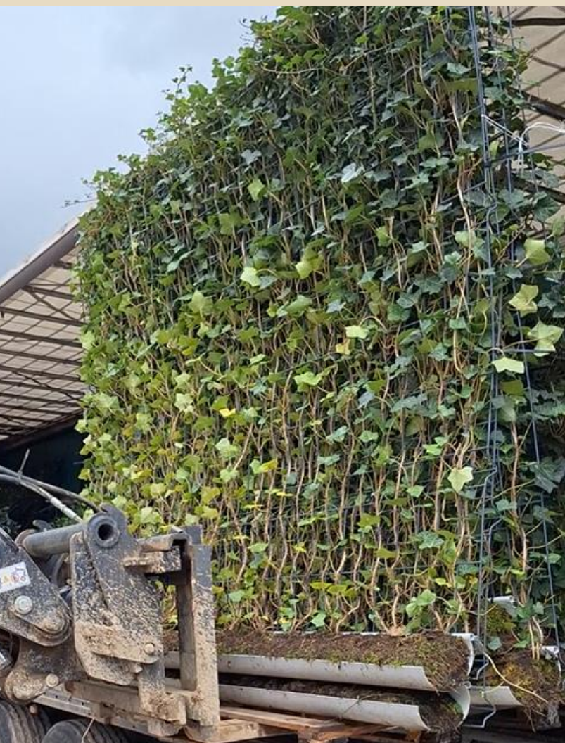
à la livraison