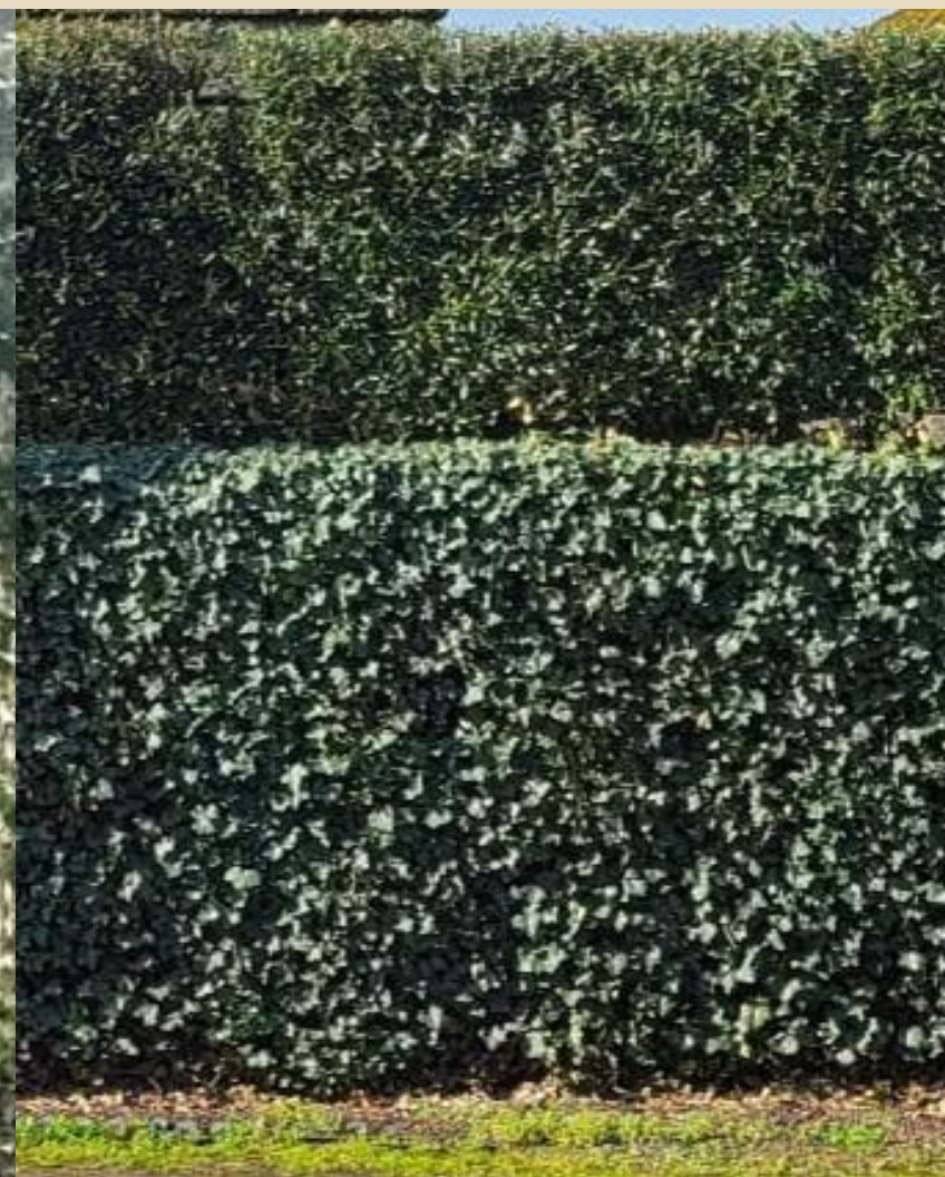
6 mois après l'installation