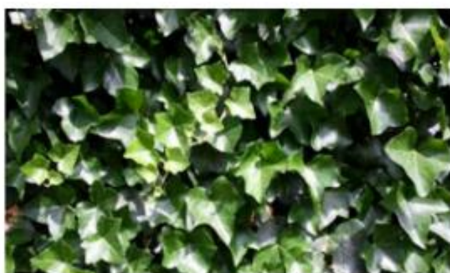
Lierre Hedera Helix Ibernica