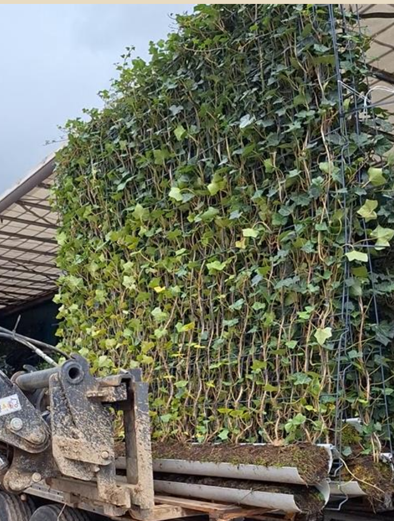
à la livraison