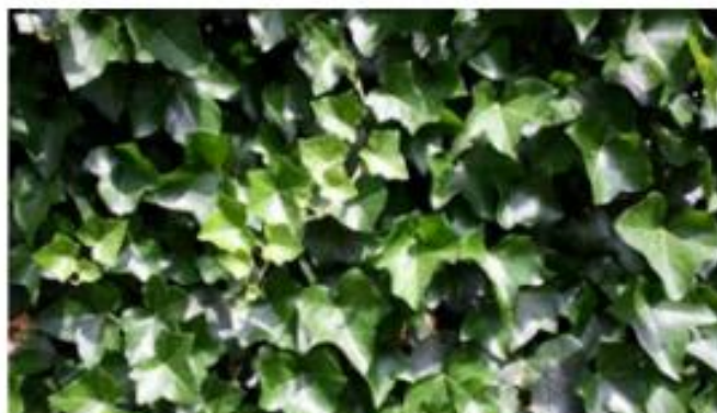
Efeu Hedera Helix Ibernica