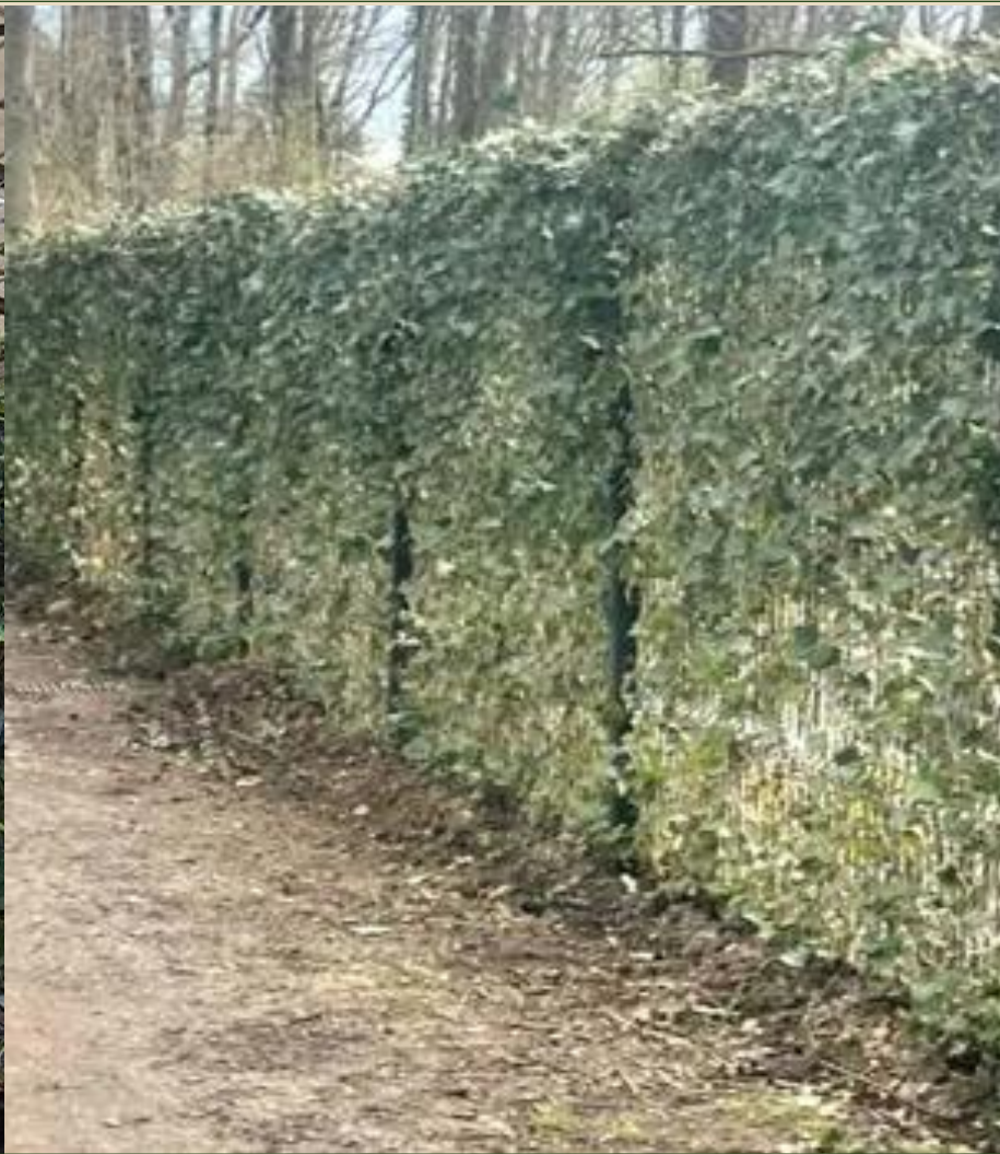
Bei der Installation